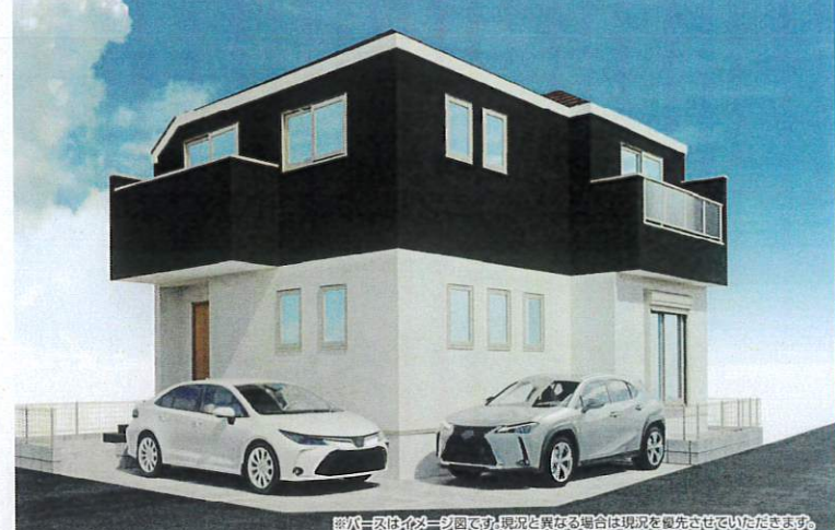
※写真はイメージ図です。現況と異なる場合は現況を優先させていただきます。